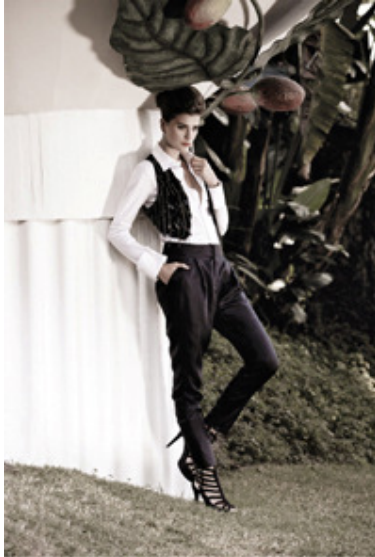
©Giuliana Romano, colección de verano 09/10

Añade que Internet es un elemento importante de su estrategia comercial. Las ofertas enviadas por correo-e cimientan la relación con los clientes y los inversores e Internet se ha convertido en una fuente de inspiración, pues ayuda a buscar nuevos productos y explorar nuevos talentos.